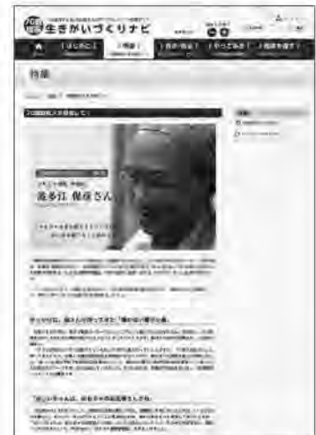
▲特集ページのイメージ