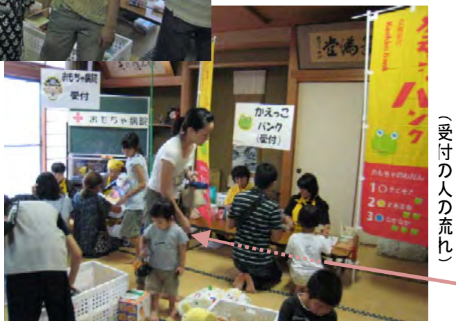
おもちゃ病院受付 かえっこ受付