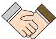
コラボレーション

使わなくなったおもちゃをポイントに交換して、そのポイントで他の子どもが持ってきた欲しいおもちゃを手に入れる子ども同士の「おもちゃ交換ゲーム」です。捨てればゴミになる不要なおもちゃをポイント交換してゴミを減らし(Reduce)、貯めたポイントで欲しいおもちゃを手に入れる(Reuse)ことを通じて、物を大切にする優しい心と環境意識を育てます。